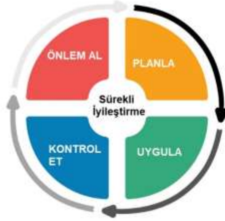
Şekil 1. PUKÖ Döngüsü

Planla: Otelimiz çevre, toplum, kültür, ülke ekonomisi ve yönetim sistemi konularına önem vermekte ve hedefler belirlemektedir. Belirlenen hedeflere ulaşabilmek için izlenecek yol haritası ve eylemleri planlamaktadır.